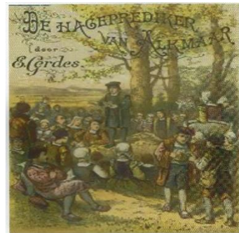
Zo ongeveer zou een hagenprediker op de Preekstoel hebben kunnen staan.