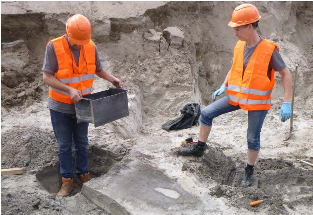
Afb. 2.: Het moment waarop de op maat gemaakte metalen bak over de afdruk wordt geplaatst. Nadat deze ongeveer 15cm diep is ingedrukt is er ene metalen plaat onder ggeschoven, waarna het spoor is gelicht. Het spoor is intact naar een restauratieatelier gebracht waar het momenteel wordt geconserveerd.