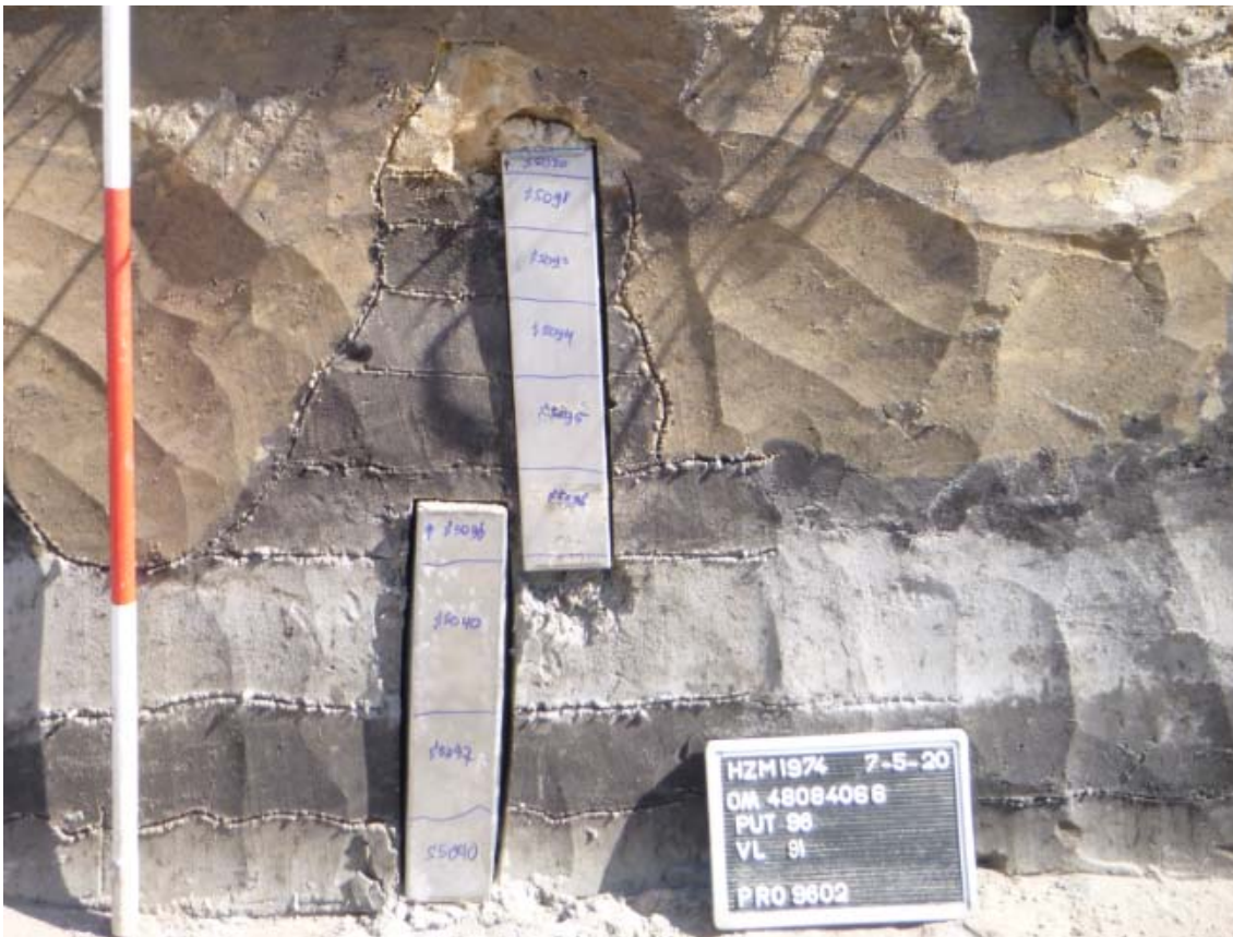
Afb. 3: Nadat de verschillende lagen zijn gedocumenteerd worden er op diverse plekken stalen bakken in het profiel geslagen. Deze bakken worden 'pollenbakken' genoemd. Hierin blijft een deel van de lagen bewaard zodat ze op een later tijdstip kunnen worden gedateerd of onderzocht op botanische resten. Op de buitenkant van de pollenbak wordt het spoornummer en de grens van de lagen geschreven.