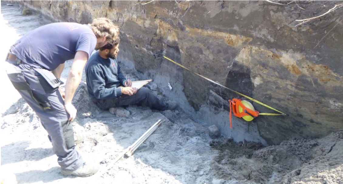
Afb. 2: De verschillende lagen worden in het profiel van de opgravingsput ingetekend en beschreven. De trechtervormige sporen zijn resten van 'moesbedden' (grondverbeteringskuilen).