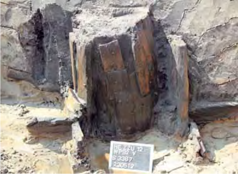
De uitgeholde boomstam die in de waterput was geplaatst, was aan elkaar 'gelast' door diverse houten planken met houten pennen, waaronder drie overnaads gedevelde planken.