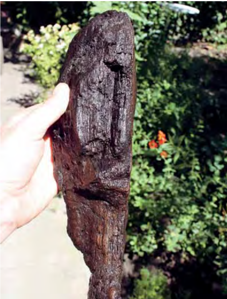
Uit de insteek van een waterput kwam een zeer bijzondere vondst, namelijk een stuk eikenhout waarin nog de helft van een menselijk gezicht te herkennen is.