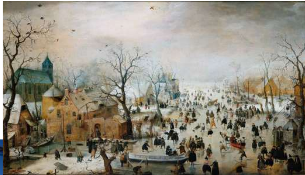
Hendrick Avercamp: Winterlandschap met Ijsvermaak, 1608 Rijksmuseum, Amsterdam