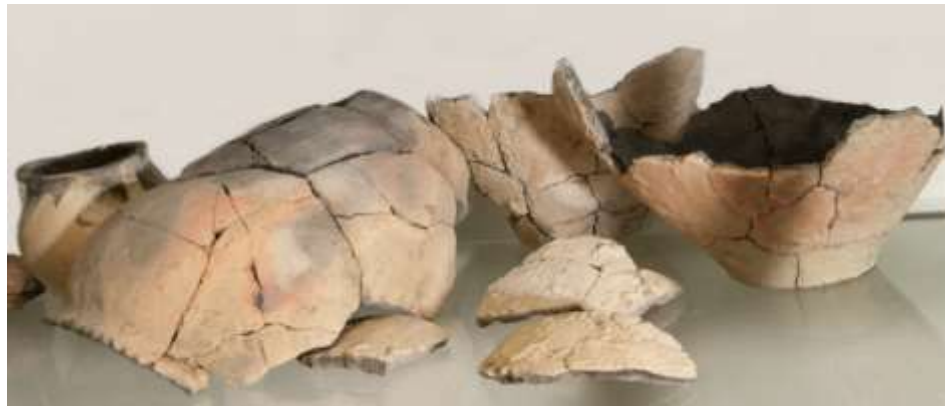
Inheems Romeins aardewerk museum Baduhenna

Bij oxiderend bakken (dit is onder toevoer van zuurstof) die in de regel wordt toegepast, zorgen de metalen in de klei voor de "gewone" kleur, die meestal rood is omdat de klei ijzerhoudend is (roestkleur).