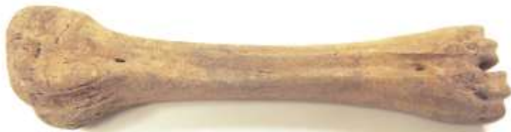
Glis Vindplaats: Landgoed Ter Coulster

Glissen (schaatsen gemaakt van bewerkt bot die onder schoenen of een prikslee werden gebonden). Er zijn meerdere glissen in Heiloo gevonden.