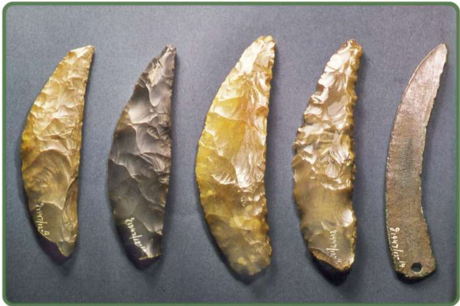
4 vuurstenen sikkels afkomstig uit Helgoland, Denemarken 1 bronzen sikkel uit Mikene, Griekenland Gevonden rond 1930 aan de Krommelaan in Heiloo Datering: ca. 1000 v.Chr.