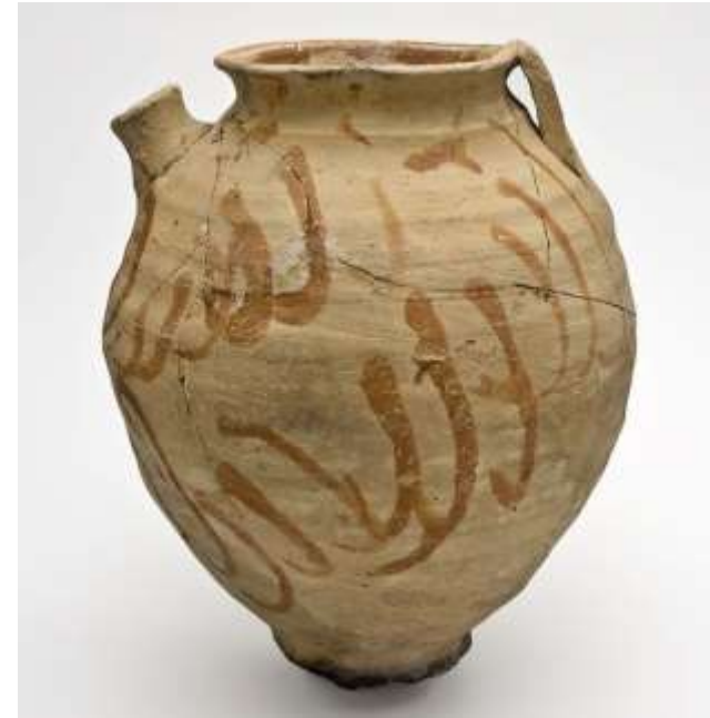
Voorbeeld Pingsdorf-aardewerk Museum Rotterdam

Vooral gebruikt zijn voorraadpotten met een tuit (tuitpotten), (drink)bekers en enkele handgemaakte kogelpotten.