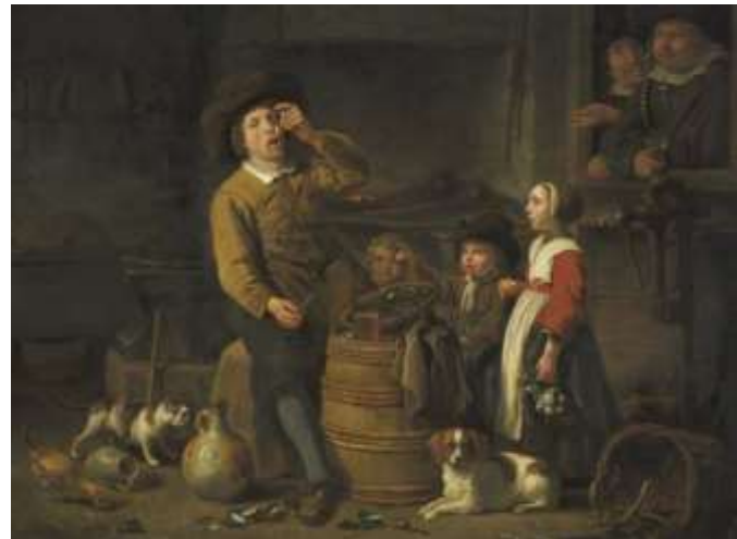
Aelbert Cuyp De mosseleter Museum Boymans Beuningen

Baardmankruiken zijn genoemd naar het bebaarde gezicht op de hals. In vroeger eeuw waren ze zeer populair. Dit blijkt onder meer uit de vele archeologische vondsten en uit afbeeldingen van de drinkkan op 17 de eeuwse schilderijen met taferelen van feesten.